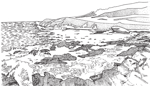
Montaña de Oro shoreline