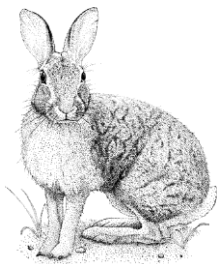
Conejo de Matorral

Premio al Último Clasificado - ¡Sabemos que es difícil ser el último grupo despedido! Cuando obtengas el premio Tail End, no serás el último en el próximo despido.