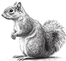
Ardilla Gris - Occidental

Como adulto, tu experiencia de vida será útil para guiar a los estudiantes durante toda la semana. Agradecemos que seas un modelo a seguir y que los apoyes en la participación en nuestro programa y rutinas. Mientras orientamos nuestra enseñanza y actividades hacia los estudiantes, ¡esperamos que también te encuentres disfrutando de nuestras aventuras en la naturaleza, juegos y canciones en la fogata!