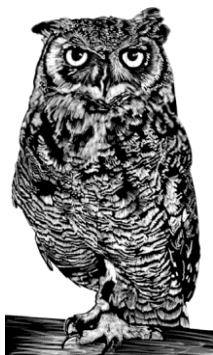
Gran Búho Cornudo

Antes de ir a su descanso, consulte con los profesores para recordarles dónde estará en caso de emergencia.